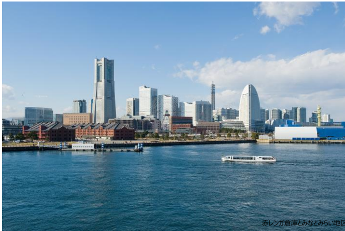
赤レンガ倉庫とみなとみらい地区

「Nostalgic 2days」を楽しんだ翌日に横浜観光をしたい方！お父さんが「Nostalgic 2days」に行っている時間に横浜巡りをしたい方も！ご参加お待ちしております！