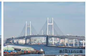
港の見える丘公園